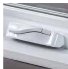
Jolie manivelle pliante et couvercle dissimulant.

Les fenêtres à auvent s'agencent à une variété d'utilisations de fenêtres; de plus, les deux poignées de verrouillage offrent un ajustement sécuritaire et étanche aux intempéries.