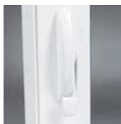
Double verrou sur le jambage assurant l'étanchéité de la fenêtre.