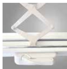
Mécanisme d'ouverture et de fermeture très robuste.