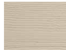
Sable de Monterey